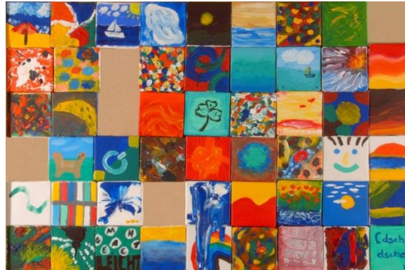
"Malen Sie Gelassenheit." gestaltet von den Teilnehmern der Feierlichkeiten meines 10-jährigen Jubiläums am 8. Juli 2011