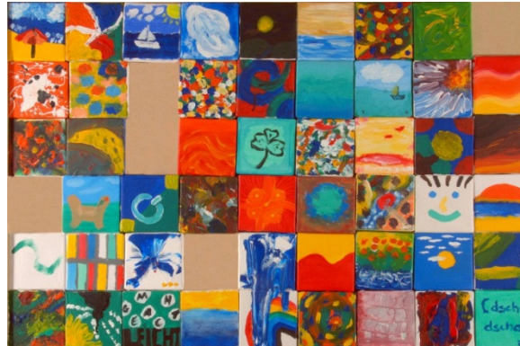
„Malen Sie Gelassenheit.“ gestaltet von den Teilnehmern der Feierlichkeiten meines 10-jährigen Jubiläums am 8. Juli 2011