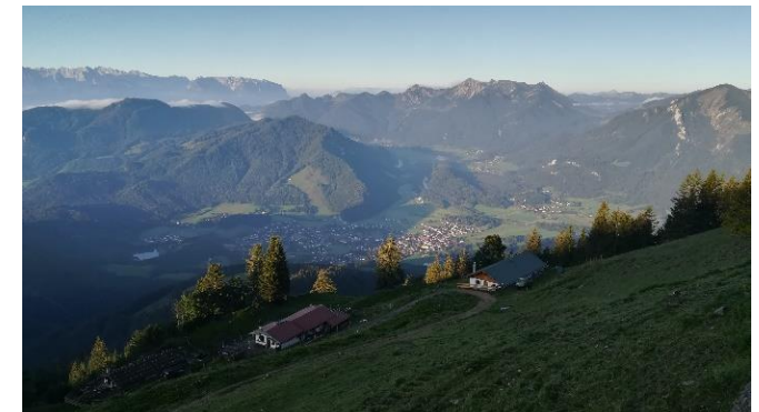
Blick vom Hochgerghaus bei Sonnenaufgang

9./10.9.2021 www.business-meets-chiemgau.de