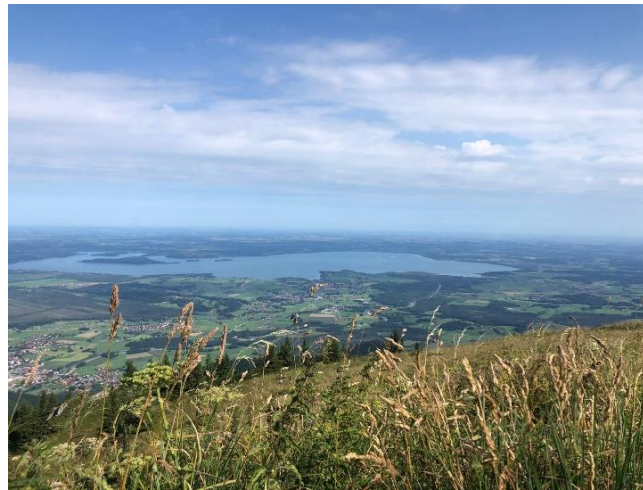
Blick vom Hochgengipfel auf den Chiemsee

“ In der Natur gibt es kein Richtig und Falsch. Es gibt Konsequenzen. (Axel Germek)